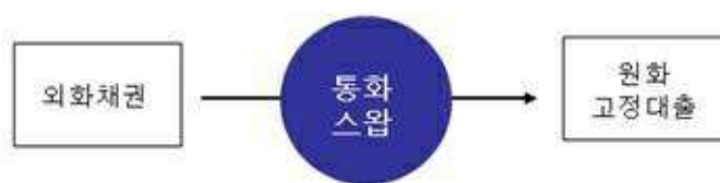
통화스왑 계약 체결 구조도